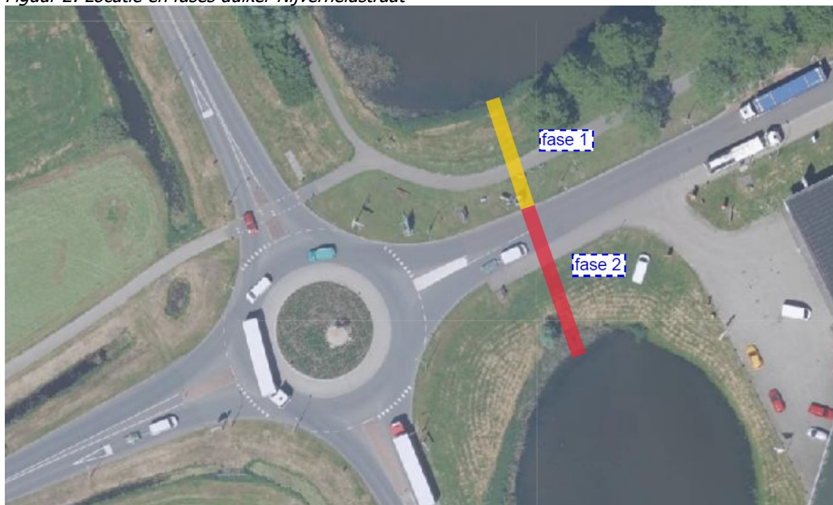
Figuur 2: Locatie en fases duiker Nijverheidstraat

Deze planning is zo nauwkeurig mogelijk samengeteld. We doen ons best om de werkzaamheden volgens planning en in zo'n kort mogelijk tijdsbestek uit te voeren.